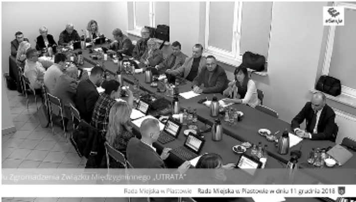
Zgromadzenia Związku Międzynarodowego „UTRATA” Rada Miejska w Piastowie: Rada Miejska w Piastowie w dniu 11 grudnia 2018